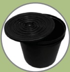
CAIXA PVC PRÉ-FORMADA