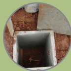
CAIXA DE ALVENARIA 0,20 X 0,20 X 0,30m COM TAMPA