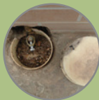
PVC DE 100mm COM TAMPÃO